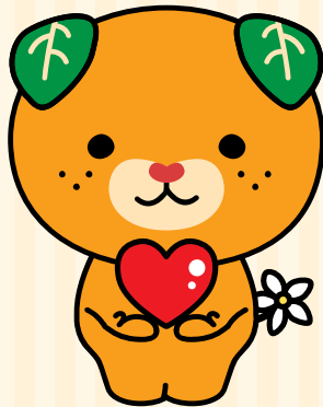
愛媛県イメージアップキャラクター「みきゃん」